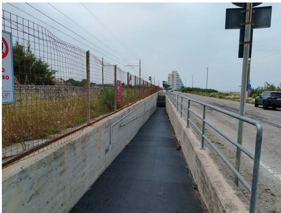
Sottopasso – Lungomare