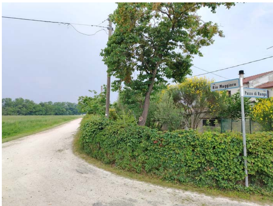
Incrocio Via Passo di Rango – Via Rio Maggiore