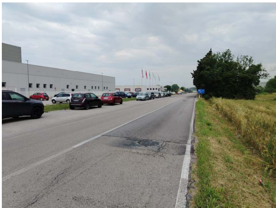
S.P. 155 – ditta SODICO