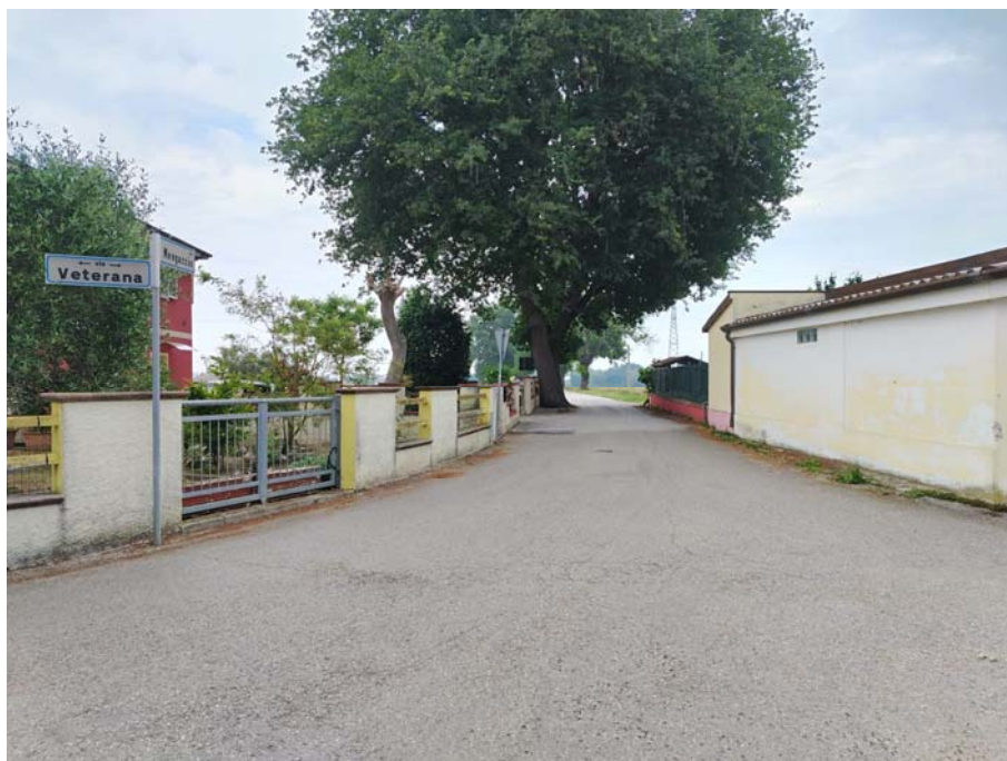
Incrocio Via Mengaccio – Via Veterana