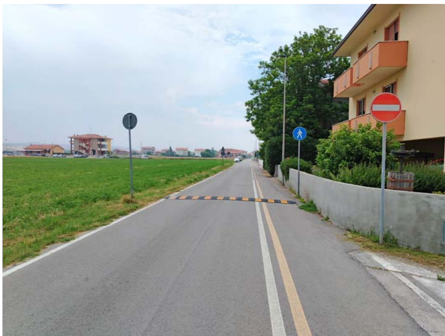
Percorso pedonale – Via Yuri Gagarin