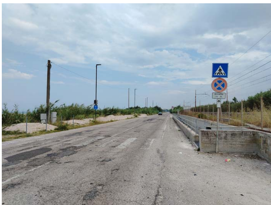
Sottopasso – Lungomare