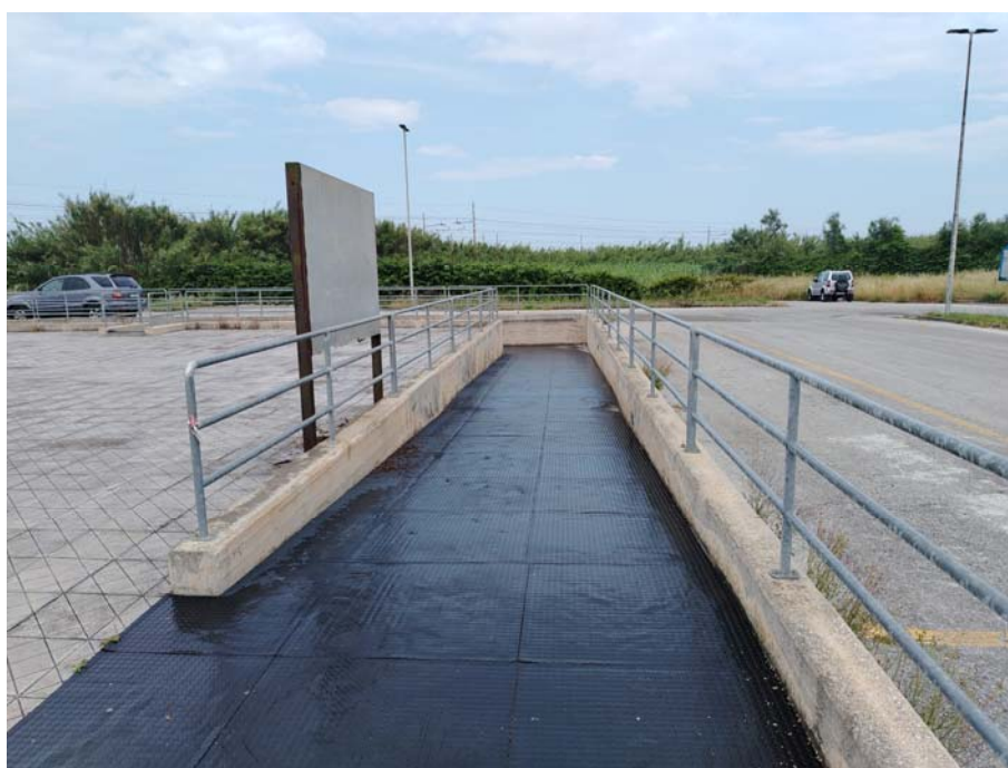
Sottopasso – Parcheggio Autoarticolati S.S. Adriatica