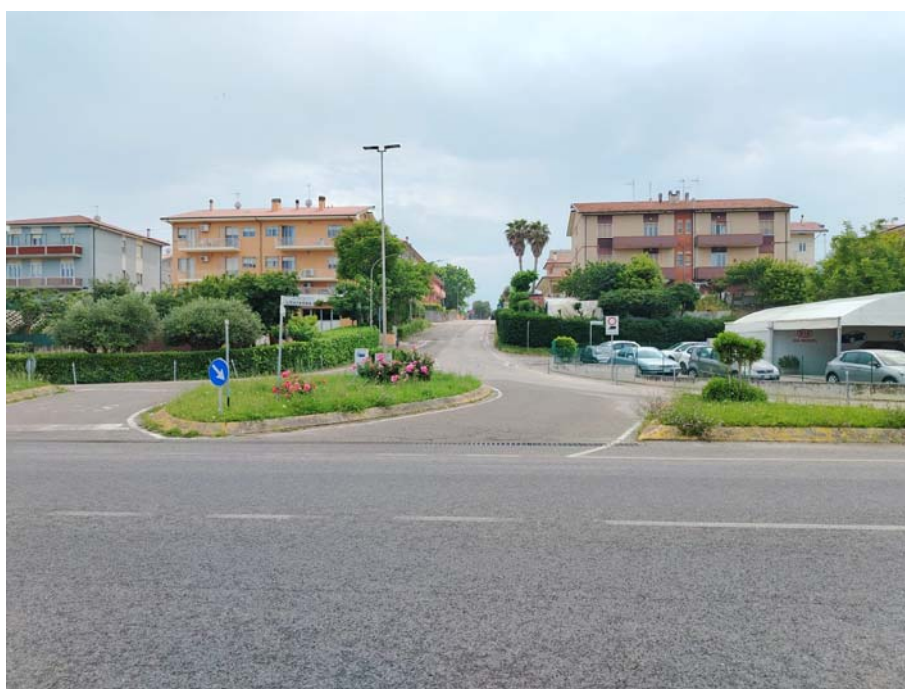
Incrocio S.S. Adriatica – Via Raffaello