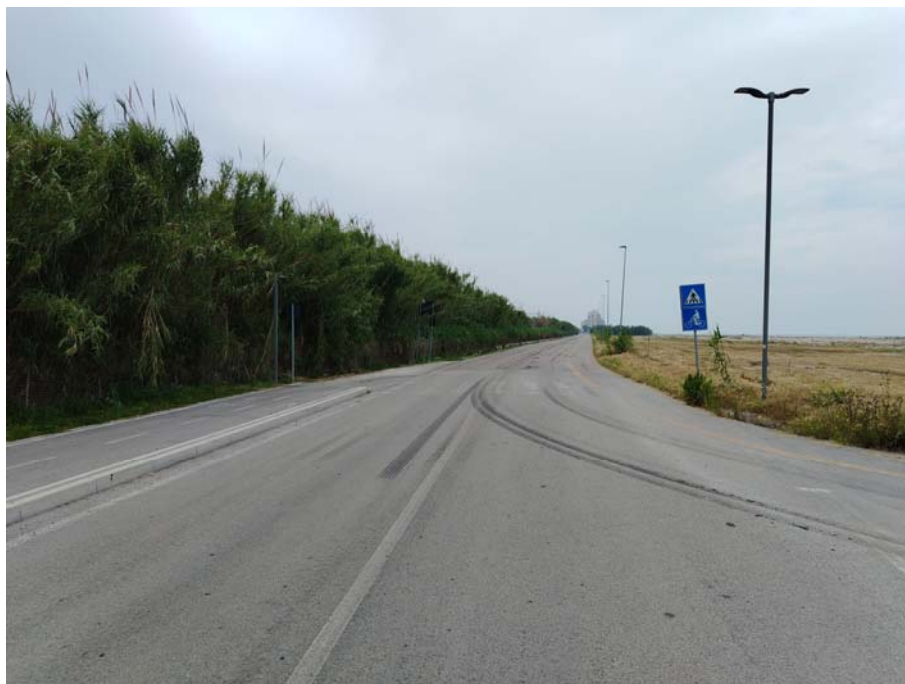
Inizio percorso – Lungomare