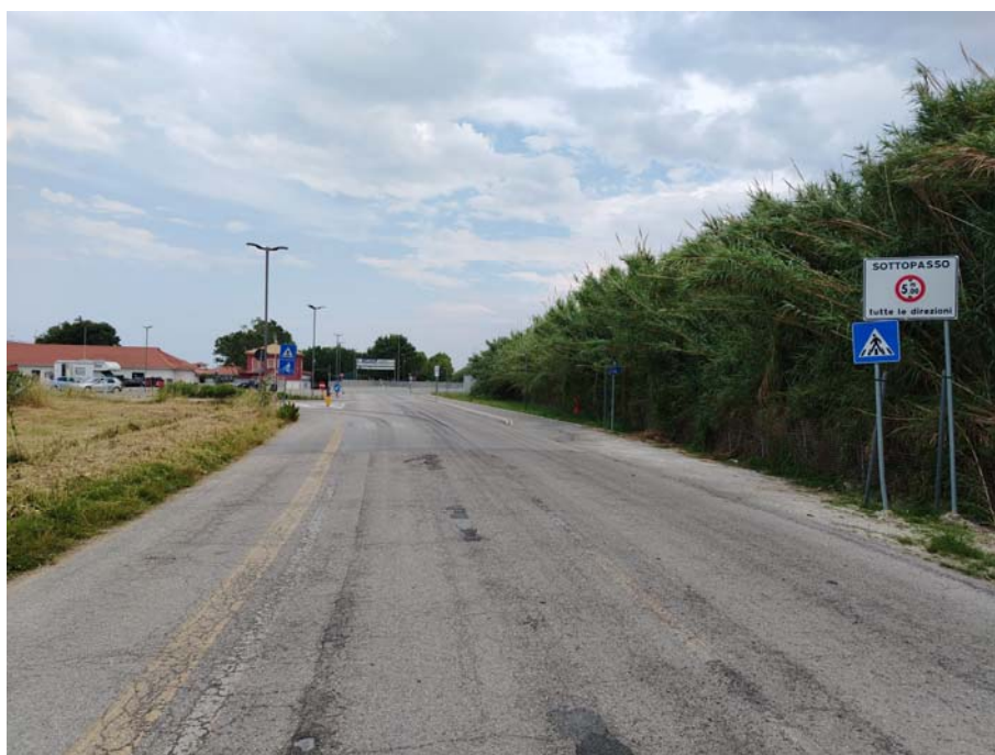
Inizio percorso – Lungomare