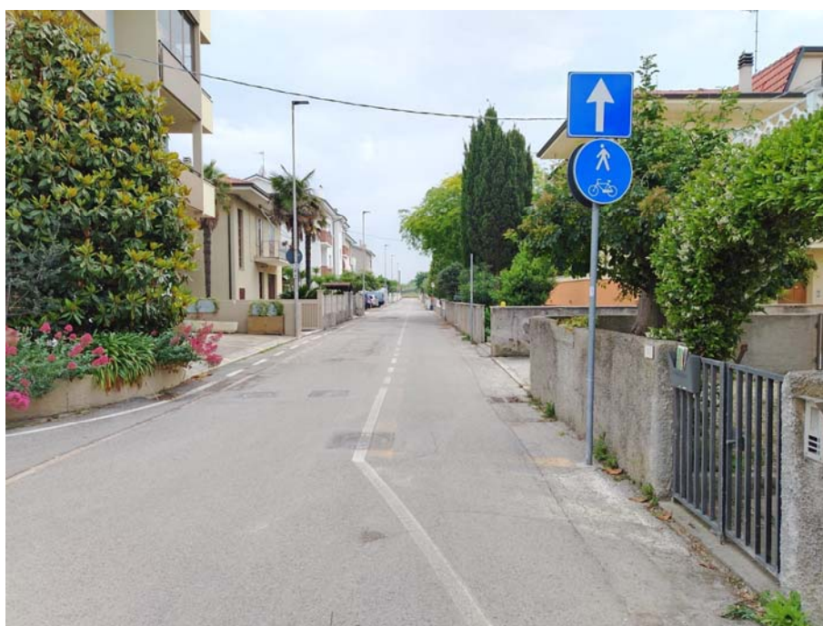
Via degli Astronauti