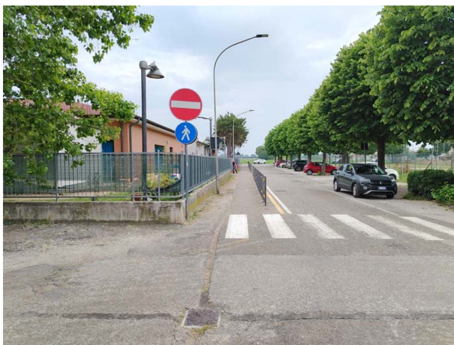
Percorso pedonale – Scuola Primaria "Raffaello"