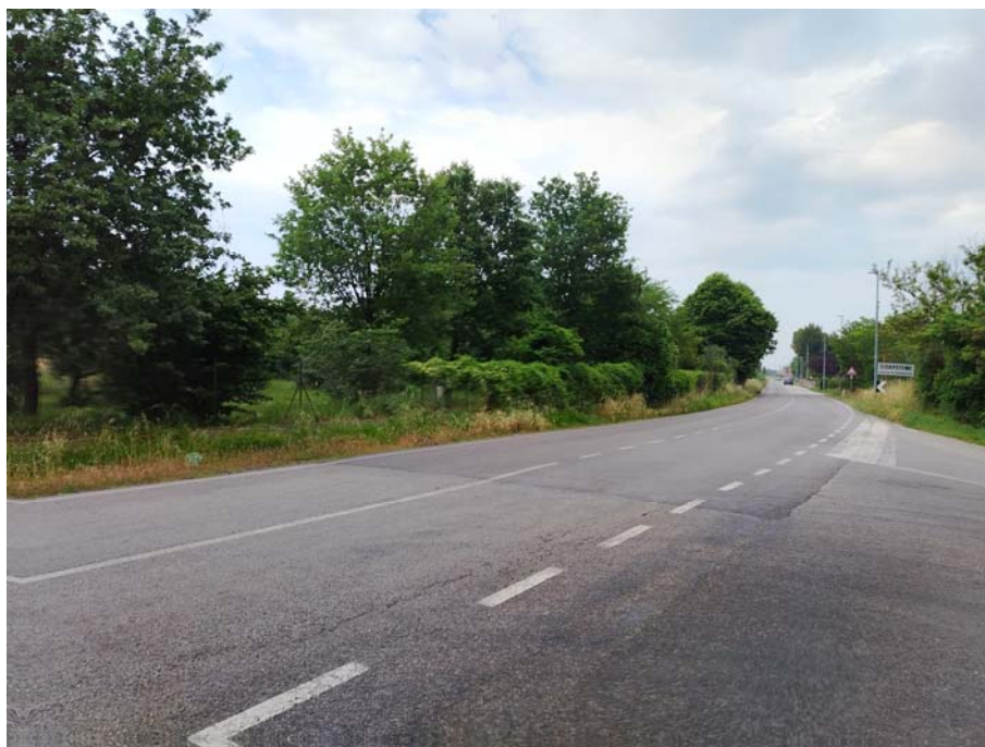
Incrocio S.P.11 – Via Molino Vecchio – direzione Senigallia