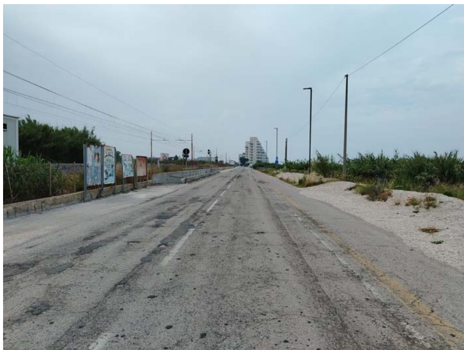
Sottopasso – Lungomare