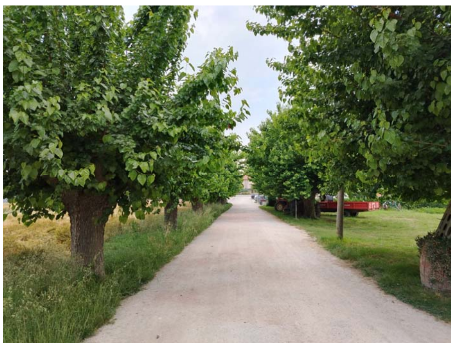
Via Rio Maggiore