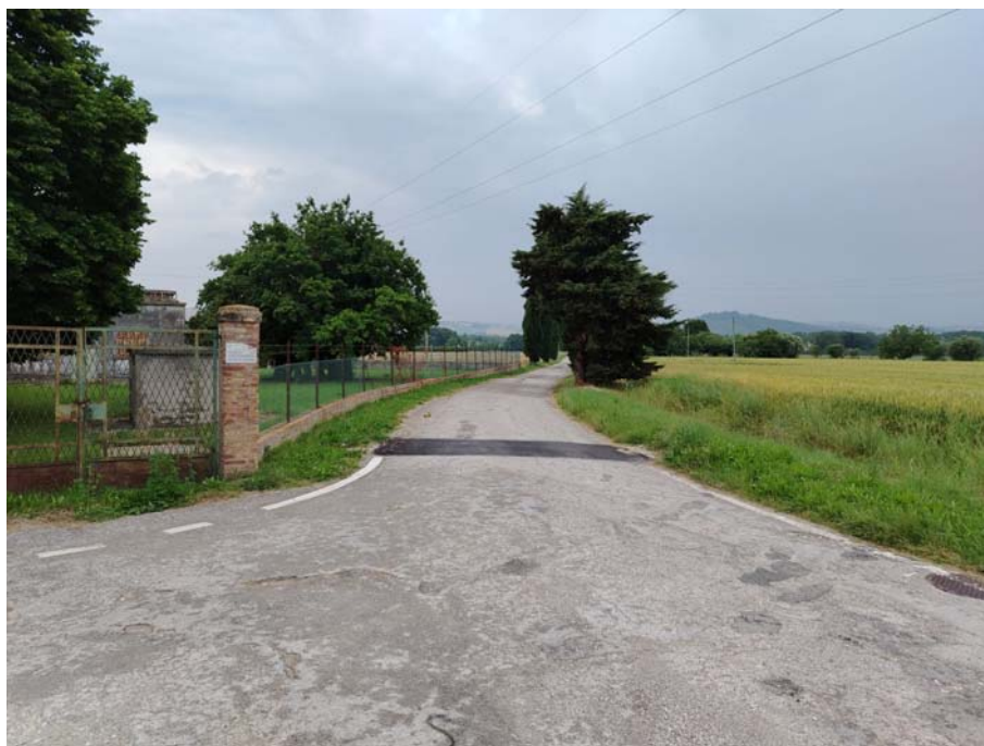
Incrocio Via Passo di Rango – Via Molinella