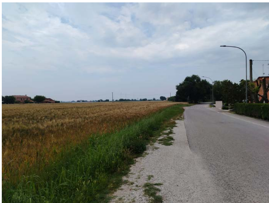
Via Molino Vecchio