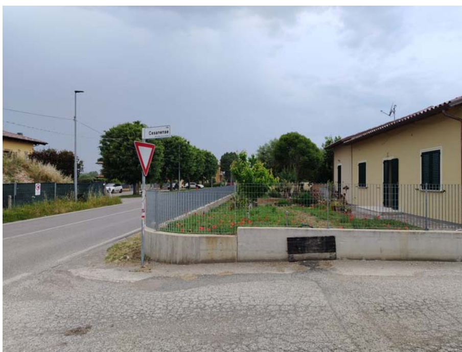
Incrocio S.P.11 – Via Cesanense