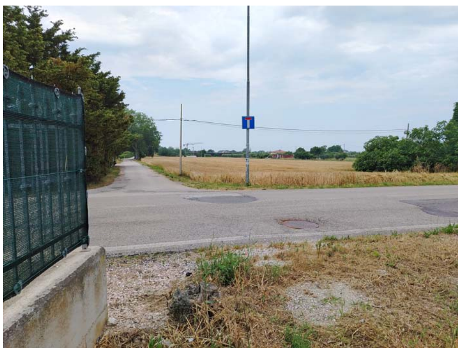
Incrocio S.P. 155 – Via Clementina