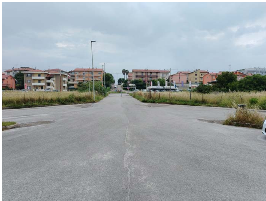
Parcheggio Autoarticolati S.S. Adriatica