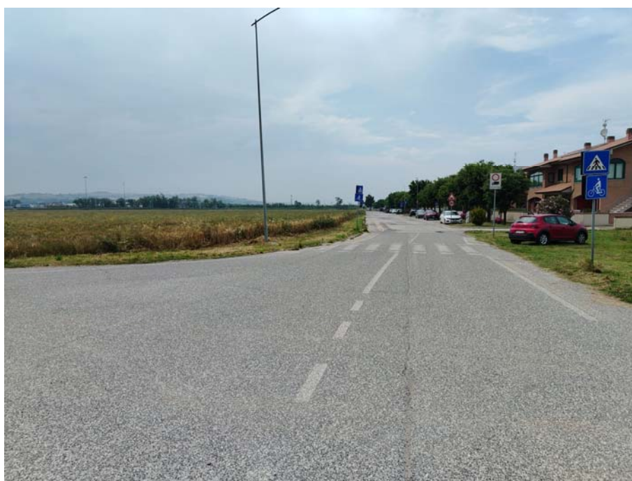
Incrocio Via della Luna – Via Leonardo da Vinci