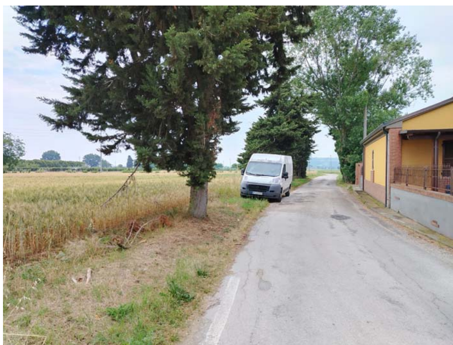
Incrocio Via Passo di Rango – Via Molinella