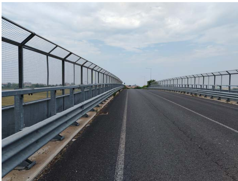
Via Leonardo da Vinci – Cavalcavia autostradale