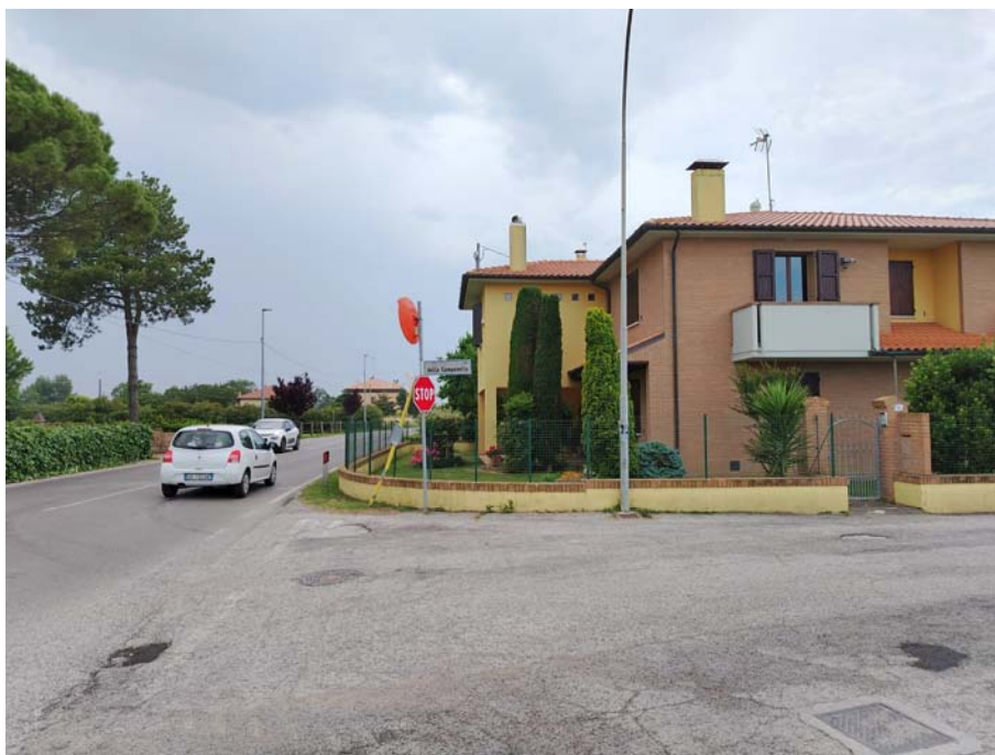
Incrocio S.P.11 – Via della Campanella