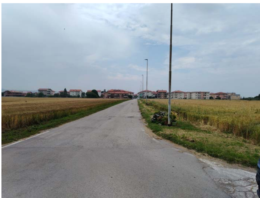
Via Yuri Gagarin