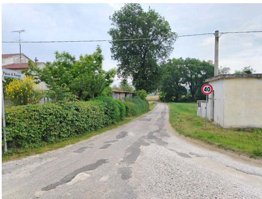
Via Passo di Rango