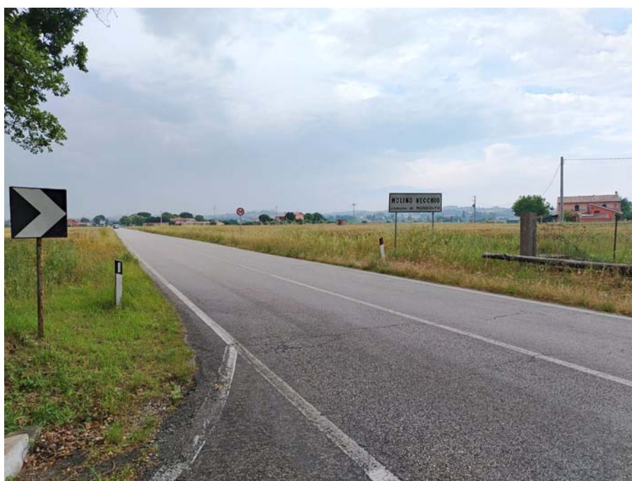
Incrocio S.P.11 – Via Molino Vecchio – direzione Mondolfo