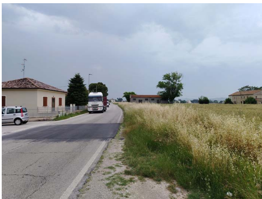
S.P.11 – direzione Mondolfo