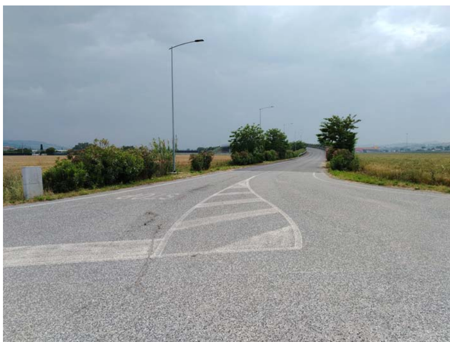
Incrocio Via Leonardo da Vinci – S.P.155