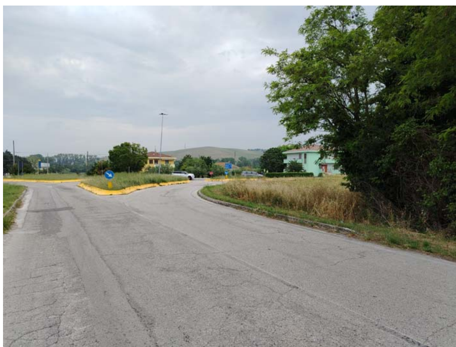
Incrocio S.P. 155 – S.P. 11