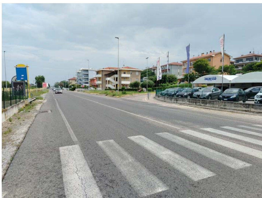
Attraversamento ciclabile – S.S. Adriatica