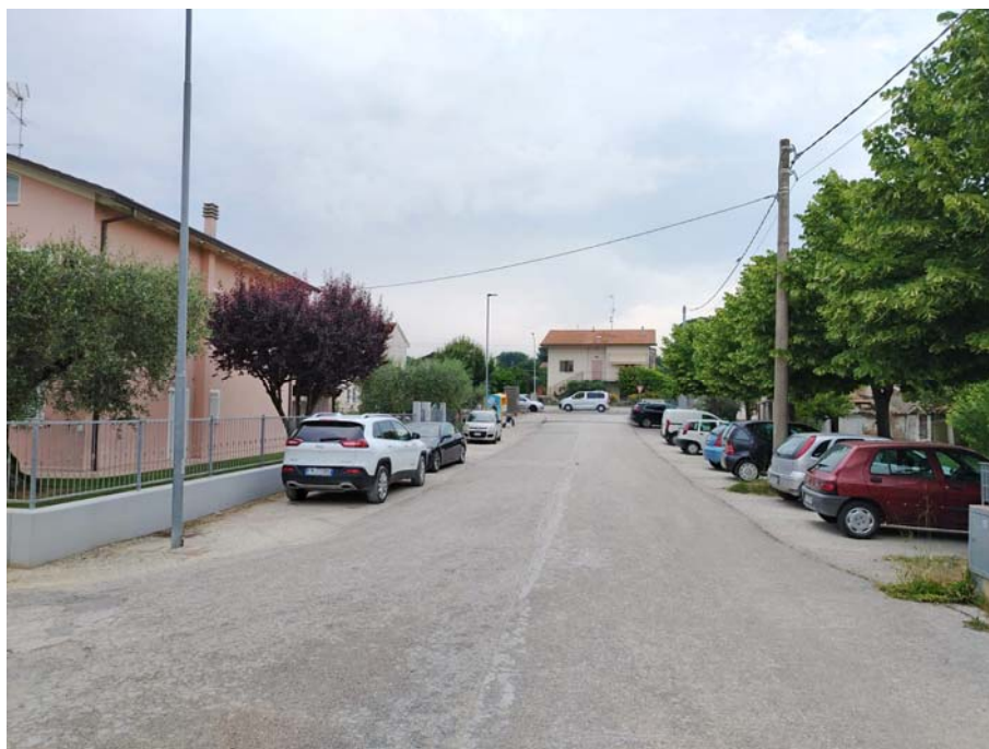
Via Rio Maggiore – direzione S.P.424