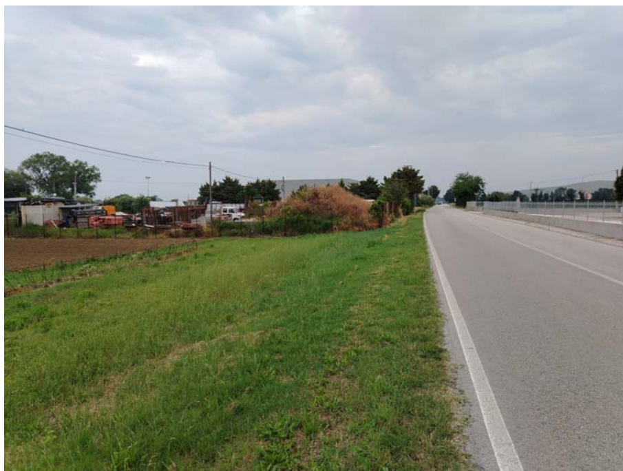
S.P. 155 – direzione Senigallia