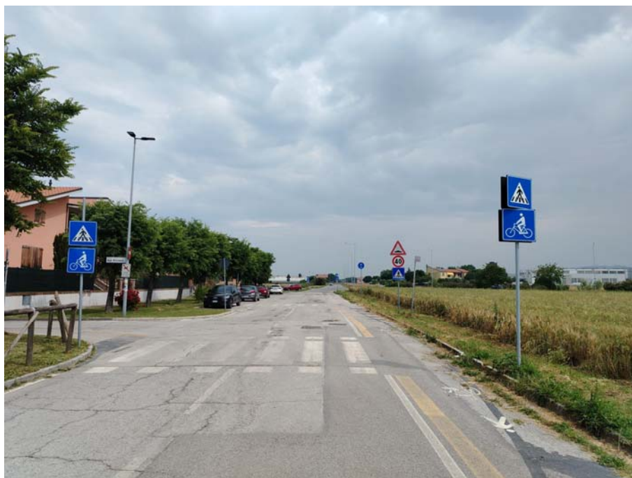
Attraversamento ciclo-pedonale Via della Luna