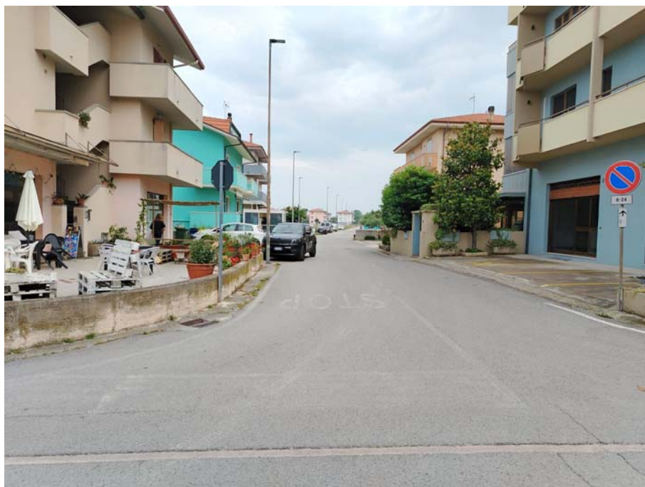
Incrocio Via Yuri Gagarin – Via degli Astronauti