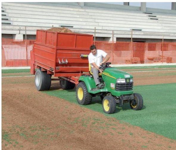
Operazione di stesura di Infillpro Geo