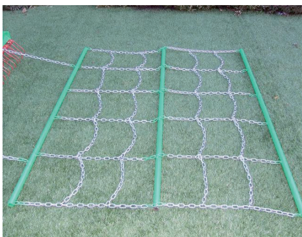
Operazione di compattazione con rete genoa