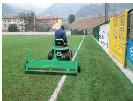
Spazzolatura con pettine a traino