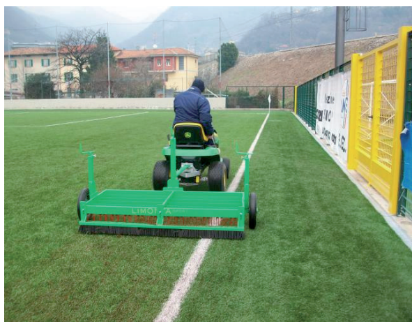
Operazione di de compattazione/spazzolatura