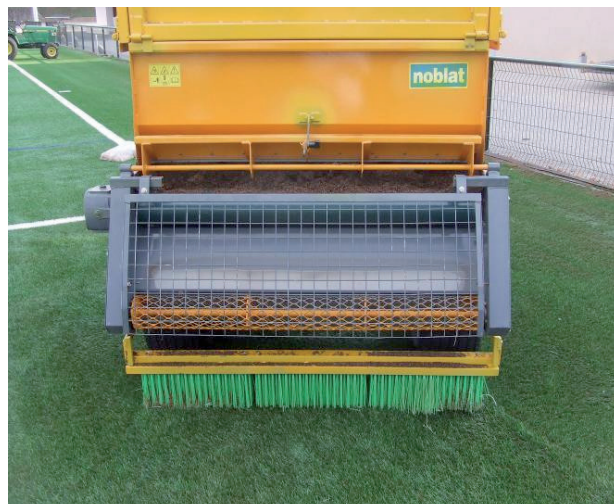
Particolare tramoggia per stesura di Infillpro Geo